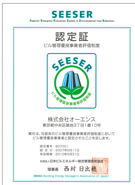
ビル管理優良事業者認定証